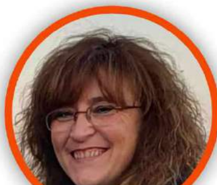
MARIANGELA MAPELLI SCUOLA PRIMARIA