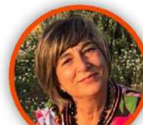
GIOVANNA MARIA BURRELLI SCUOLA PRIMARIA