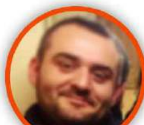
ROBERTO ZOLLO SCUOLA PRIMARIA